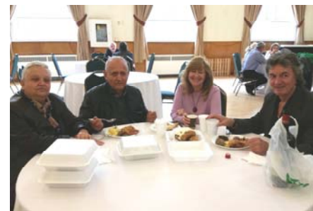
LONG-TIME CHURCH MEMBERS & GUESTS ATTENDING THE BAZAAR

Church Fall Bake-Sale on October 6, 2019 was a big success. We would like to thank each and everyone, who took part in the setting up of the hall, baking baklava, banitzi, burek, preparing the delicious lunch and serving on the day of the event. Many thanks to all volunteers, to those who donated baked goods and all, who attended the event.