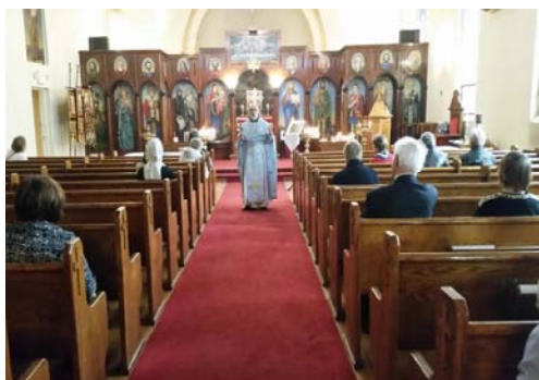
SUNDAY DIVINE LITURGY – OCTOBER 6, 2019