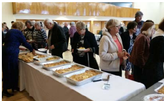
PEOPLE BUYING DELICIOUS BAKED GOODS AND LUNCH