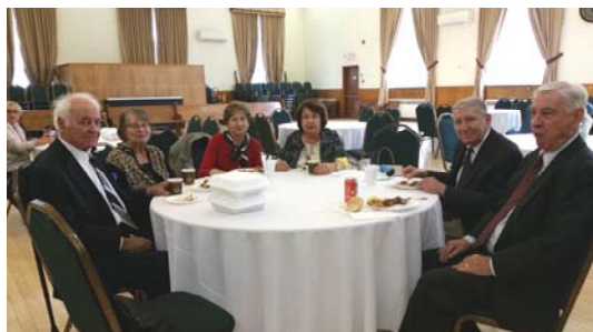
LONG-TIME CHURCH MEMBERS ATTENDING THE BAZAAR