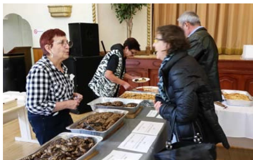
LUNCH TABLE WITH DELICIOUS KEBAPCHETA & KUFTETA