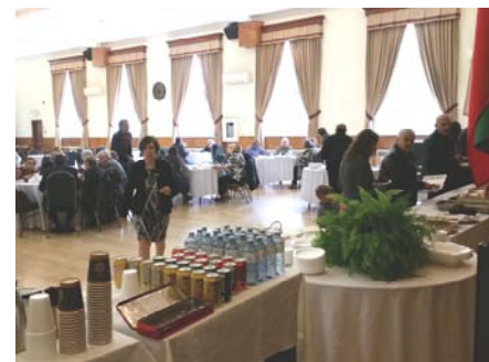
CHURCH TRADITIONAL BAKE-SALE – SUNDAY, OCTOBER 6, 2019