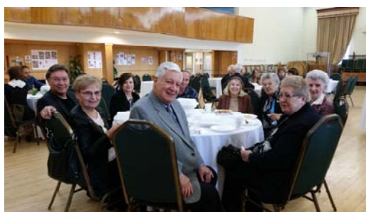
LONG-TIME CHURCH MEMBERS & GUESTS ATTENDING THE BAZAAR