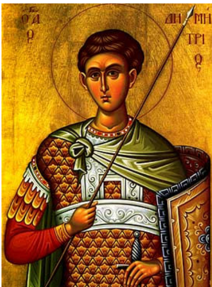
270 – 306

Църквата чества празника на Св. Иван Рилски, всяка година на 19 окт.