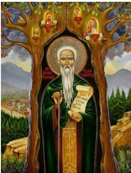
876 – 946